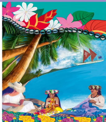
Bild zum Weltgebetstag 2025 mit dem Titel „Wonderfully Made“ von den Künstlerinnen Tarani Napa und Tevairangi Napa © 2023 World Day of Prayer International Committee, inc.

Mehr Informationen: www.weltgebetstag.de